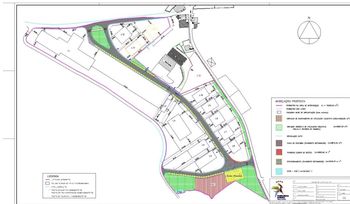
Fig 2 – Planta com alterações

Atento as alterações atrás enumeradas e descritas, a figura seguinte explicita graficamente as mesmas: