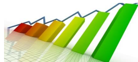
Tabela 3. Quadro de referência: Metas de Portugal no âmbito da Estratégia Europa 2020

As metas de sucesso da Estratégia Municipal Pampilhosa da Serra 2020 foram definidas de acordo com os indicadores estabelecidos à escala europeia e nacional, com o devido enquadramento nas metas da Europa 2020 (tabela seguinte) e adaptação à realidade local.