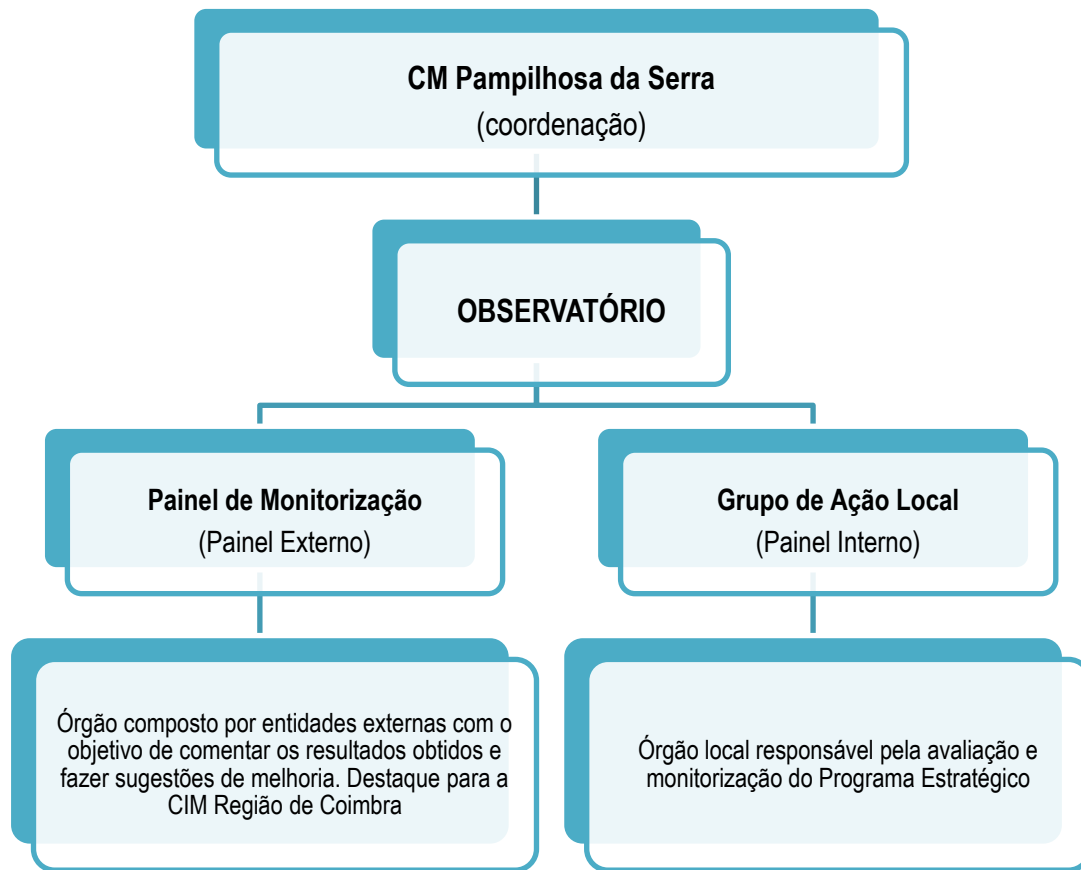
Figura 3. Modelo de Governação

Para a governação sugere-se as seguintes etapas: