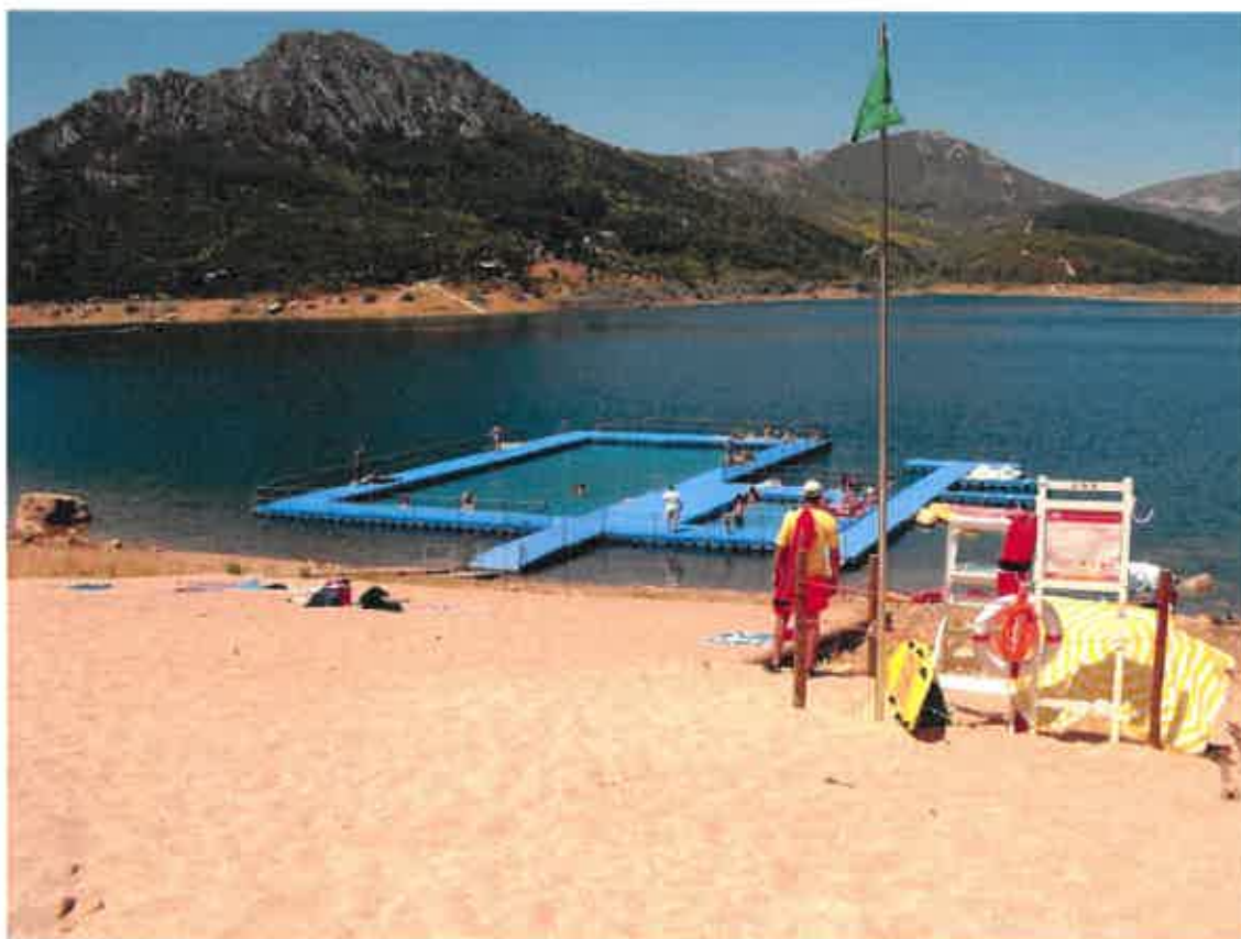
F_01 (Posto de vigia da praia)