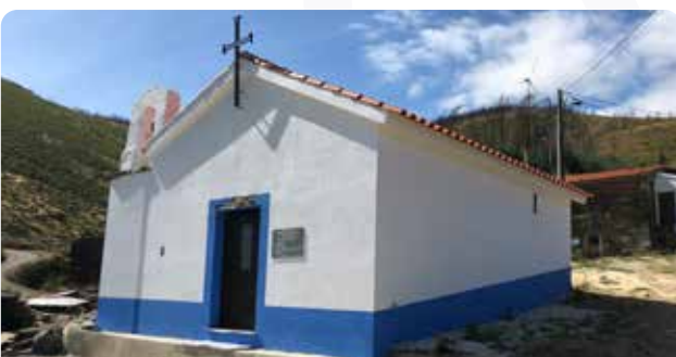
Apoio à povoação de Decabelos, na reconstrução da Capela