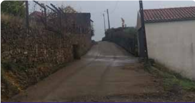
Pavimentação de arruamentos em Selada da Porta