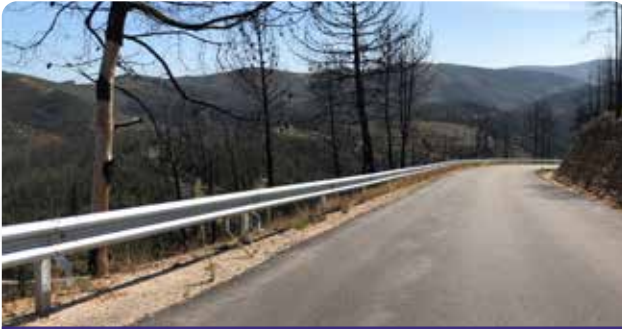
Trabalhos de limpeza e colocação de guardas metálicas na estrada Pescaneco – Alto de Fajão