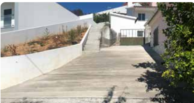
Colocação de cimento em arruamento em Sobral Magro