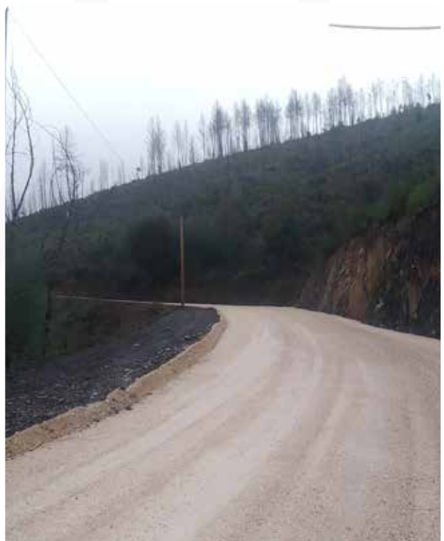
Alargamento de curva na estrada da Povoa