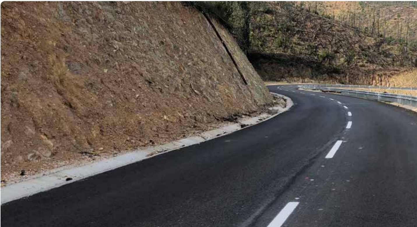
Trabalhos de retificação e alargamento da estrada Sobral de Cima - Cruzamento EN112