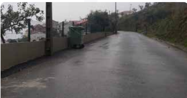
Pavimentação de arruamentos em Brejo de Cima