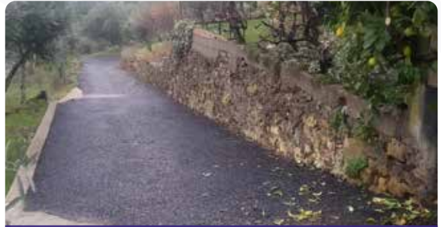
Pavimentação de arruamentos em Machialinho