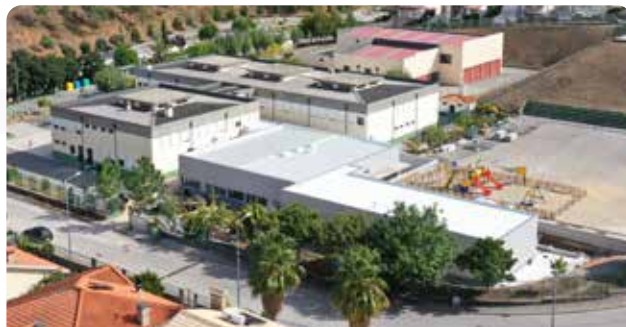
Trabalhos de construção de novo bloco, na escola sede do A.E. Escalada, Pampilhosa da Serra