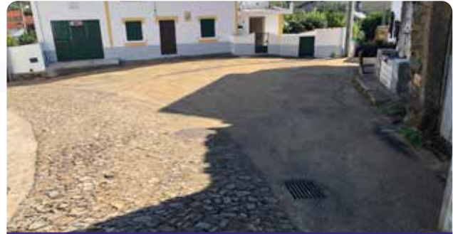
Reposição de pavimento e diversas reparações em arruamentos em Vidual de Cima