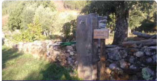
Apoio à Comissão de Melhoramentos de Porto de Vacas, na requalificação de parque de lazer