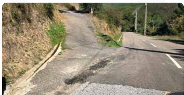
Reparação/substituição de condutas em Carregal