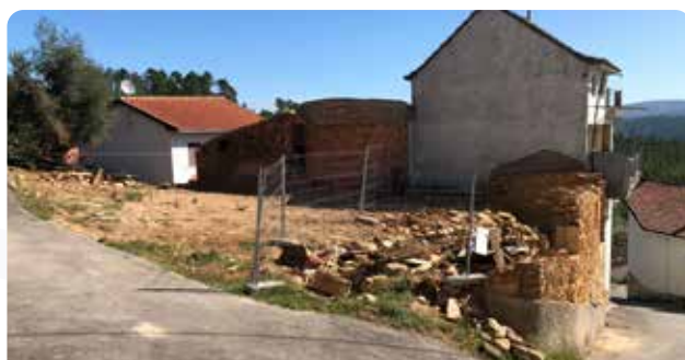
Demolição de casas em Brejo de Baixo e Sobral Valado, para alargamento de arruamentos