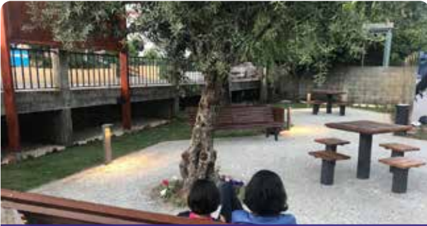
Apoio à Junta de Freguesia de Dornelas do Zêzere na requalificação de jardim público