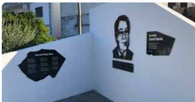
Trabalhos de construção do Parque Prof. Ramos Mendes em Sobral Valado