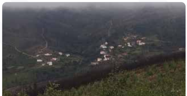
Colocação de aquedutos na Freguesia do Cabril (Ribeiros)