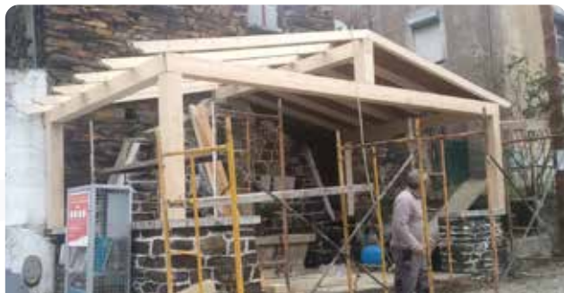
Construção de telheiro em Ceiroquinho