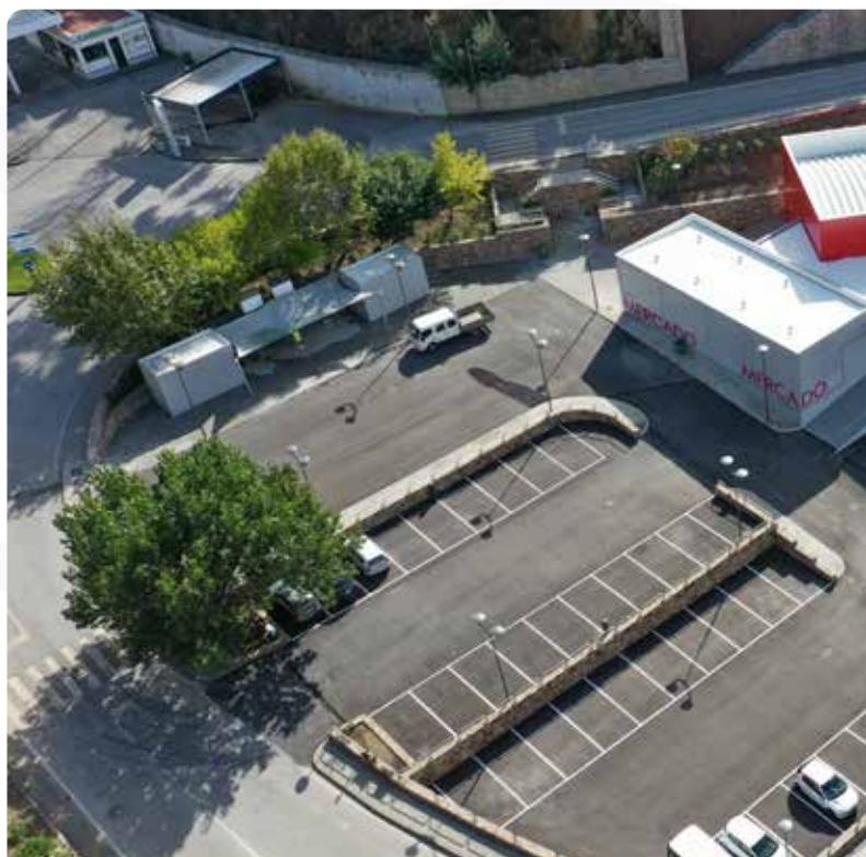
Finalização dos trabalhos de requalificação do Mercado Municipal