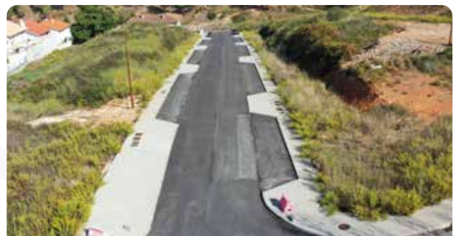
Pavimentação de arruamento no Bairro de S. Martinho – Pampilhosa da Serra