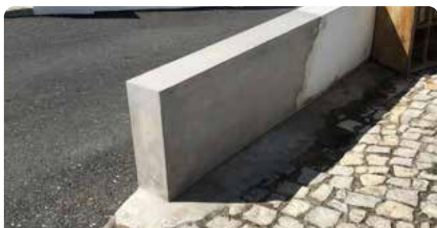
Reparação de muro em Trinhão