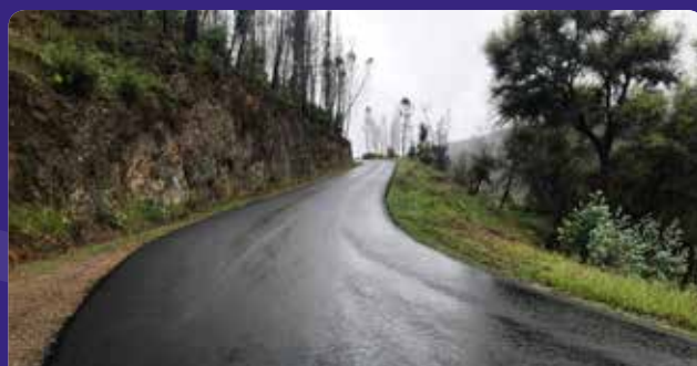
Pavimentação da estrada Rotunda do Carvoeiro - Pessegueiro