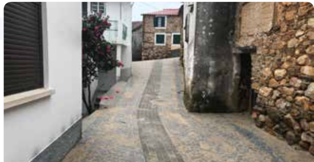
Finalização da requalificação de arruamentos em Cabril