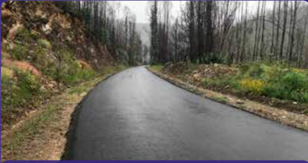
Pavimentação da estrada Pessegueiro - Carvalho