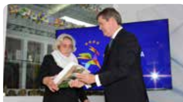
Grupo Musical Fraternidade Pampilhosense - 5.000 €