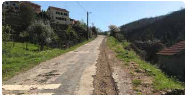
Finalização dos trabalhos de colocação de condutas de águas para abastecimento em Carvalho