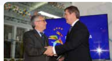
Casa do Concelho de Pampilhosa da Serra - 7.000 €