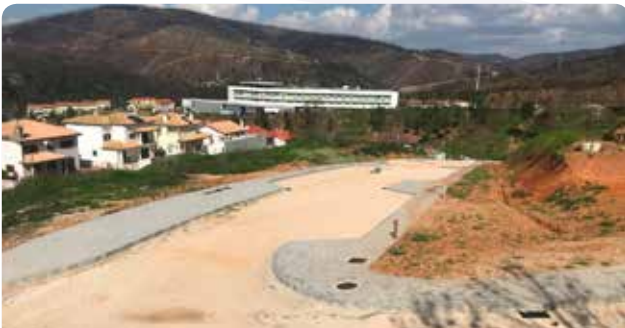
Continuação dos trabalhos da 2ª fase do alargamento da Quinta de São Martinho