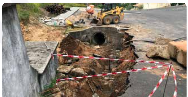
Construção de muro para suporte de via em Pampilhosa da Serra