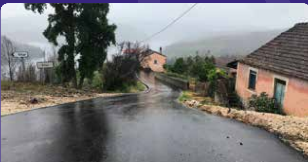
Pavimentações em Vilar

A maior porção do valor global de investimento destinou-se à reabilitação do pavimento (1 794 798, 47€), enquanto que os valores destinados à sinalização e ao equipamento urbano, fixaram-se em 59 560, 98€ e em 25 402, 90€, respetivamente.