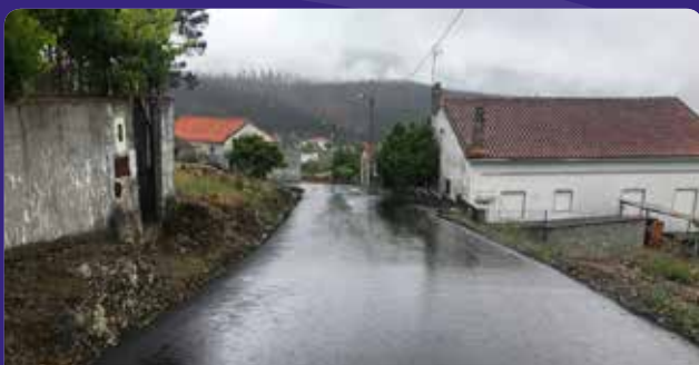
Pavimentações em Coelhal