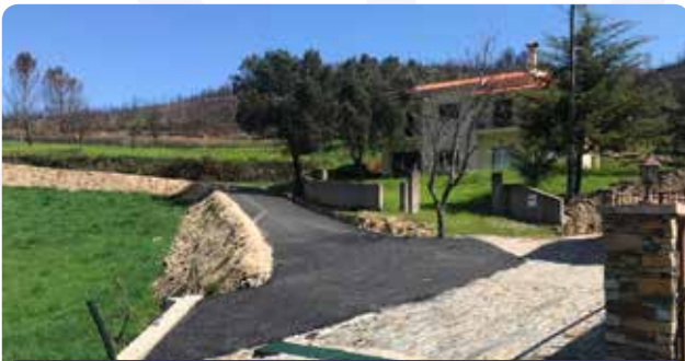
Pavimentação de novo arruamento em Porto da Balsa