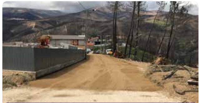
Pavimentação de novo arruamento em Pampilhosa da Serra