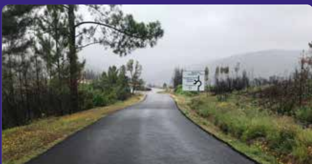
Pavimentação da estrada Ramalheira - Carvoeiro