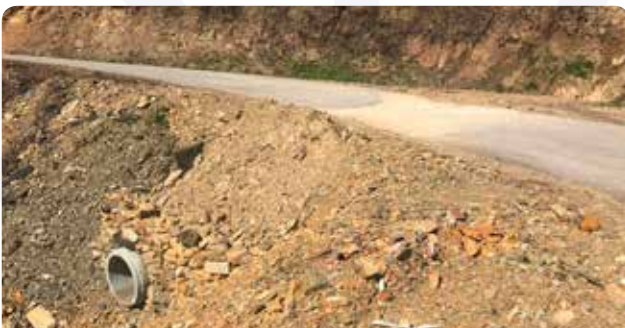
Colocação de aquedutos na estrada Pampilhosa da Serra - Pescansecos