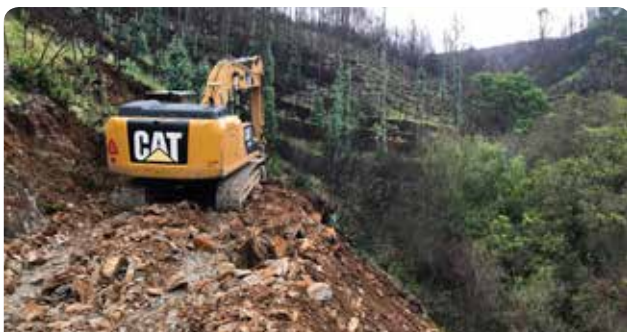
Início dos trabalhos de abertura de estrada para captação de água em Vale Pardieiro