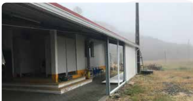
Trabalhos de requalificação nas instalações do CMA