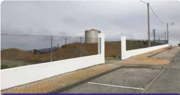
Colocação de vedação nos estaleiros municipais em Portela de Unhais