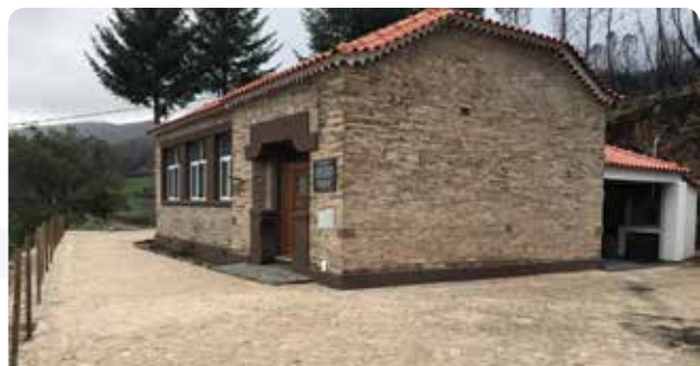
Requalificação de arruamento junto à antiga escola em Porto da Balsa