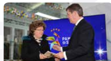
Rancho Folclórico de Pampilhosa da Serra - 5.000 €