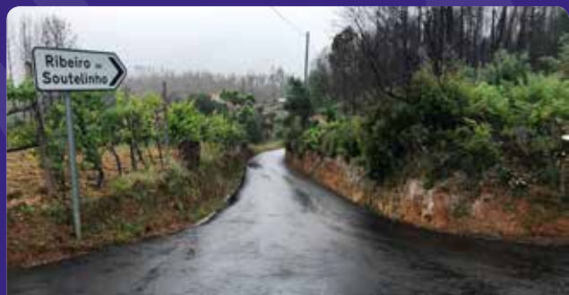
Pavimentação da estrada Ribeiro Soutelinho - Felgueiras