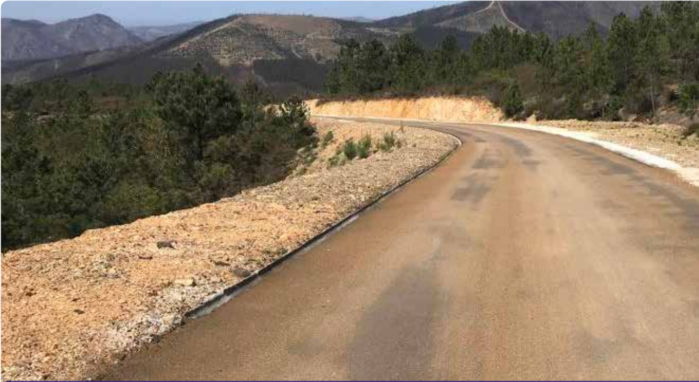
Finalização da retificação e alargamento da estrada Alto Ceiroco - Camba