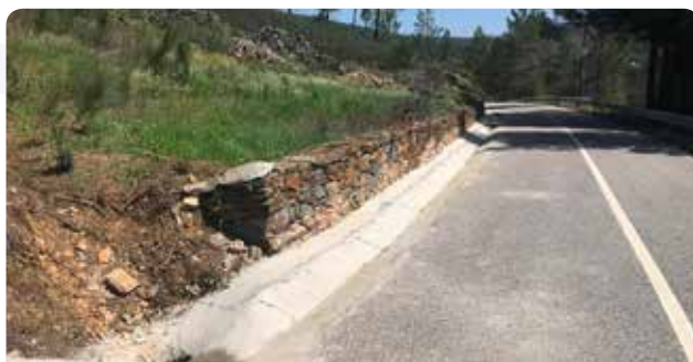
Colocação de cimento em valetas em Unhais-o-Velho e Malhada do Rei