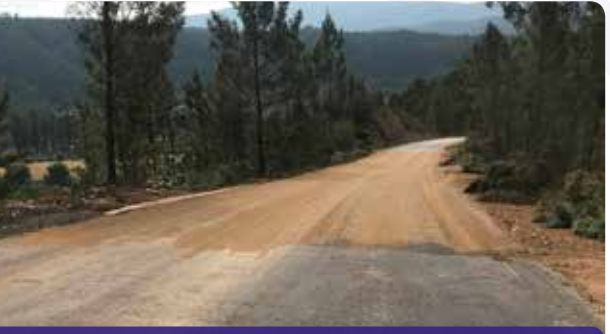
Trabalhos de requalificação da estrada Portela do Armadouro - Janeiro de Baixo