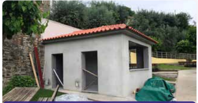
Requalificação do bar de apoio na praia fluvial de Dornelas do Zêzere