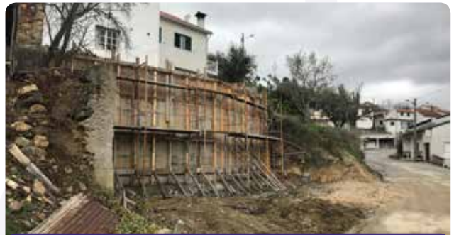
Construção de muro de suporte em Esteiro