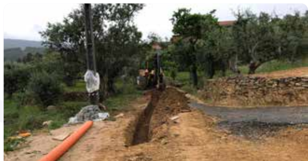
Prolongamento da rede de saneamento em Machial