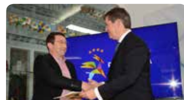
Grupo Desportivo Pampilhosense 5.000 €