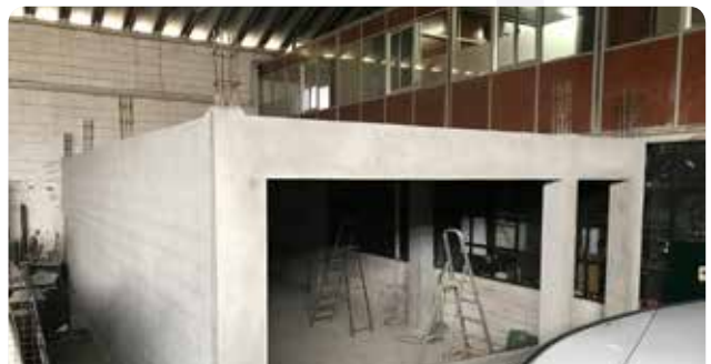
Construção de novo armazém nos estaleiros municipais