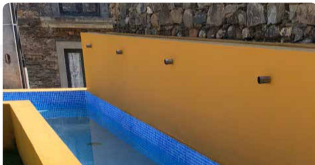
Reparação de fonte em Janeiro de Baixo