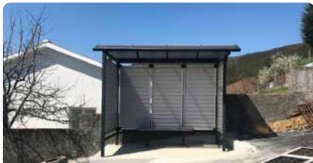
Colocação de paragens de autocarro