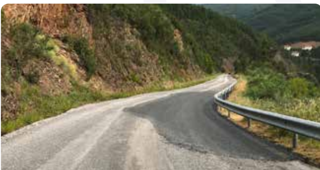
Início dos trabalhos de regularização de pavimento da estrada Janeiro de Baixo - Esteiro