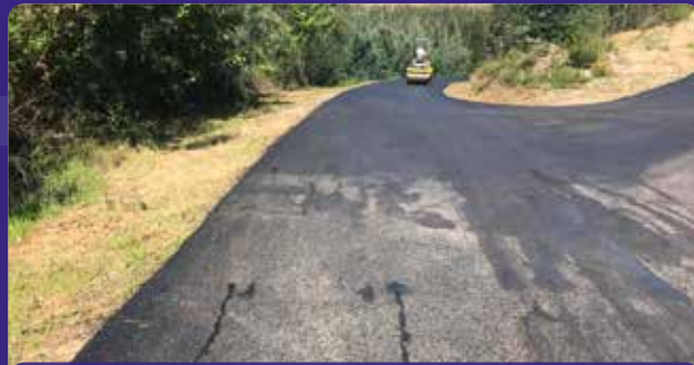
Pavimentação da estrada Amoreira - Ribeiro Indioso