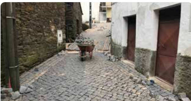
Trabalhos de requalificação de arruamentos em Meãs