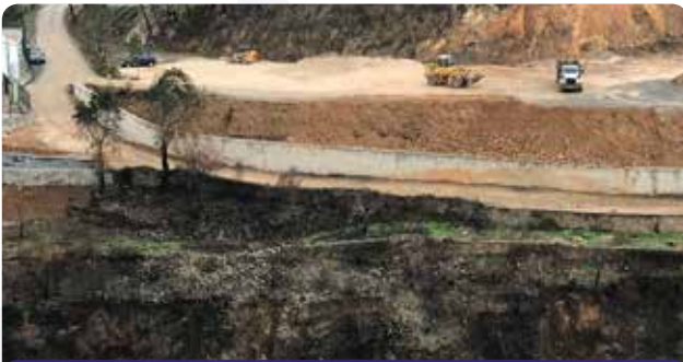
Finalização de construção de muro para alargamento de via em Pampilhosa da Serra