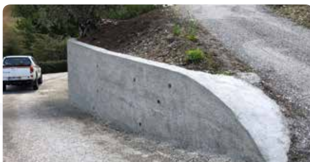
Construção de muro para alargamento de via em Malhada do Rei