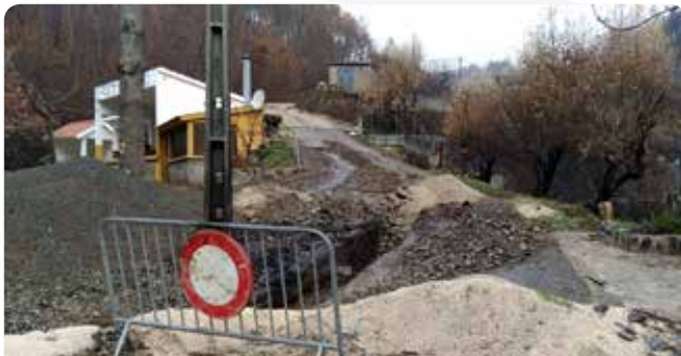
Finalização dos trabalhos de substituição de condutas de água em Ponte de Fajão