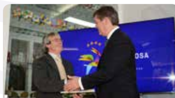
Rancho Folclórico de Dornelas do Zêzere - 5.000 €