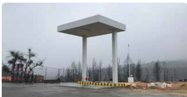
Construção de novo posto de abastecimento de combustíveis nos estaleiros municipais