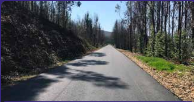
Pavimentação da estrada cruzamento EN344 - - Machio de Baixo - Machio de Cima - EN344