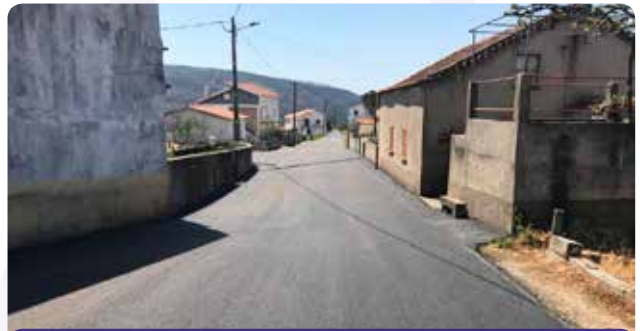
Pavimentação da estrada/arruamento em Aldeia Fundeira