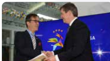
Ass. Hum. dos Bombeiros Voluntários de Pampilhosa da Serra - 250.000 €

Como é habitual, neste dia histórico para a vida Concelhia, foram celebrados protocolos de colaboração com instituições locais, como reconhecimento do papel fulcral que as mesmas representam no seio da nossa comunidade, em áreas como o desporto, as tradições culturais ou a solidariedade social. Assim, foram agraciadas as seguintes instituições: