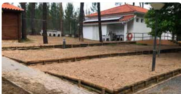
Diversas reparações/melhorias no parque de campismo de Janeiro de Baixo