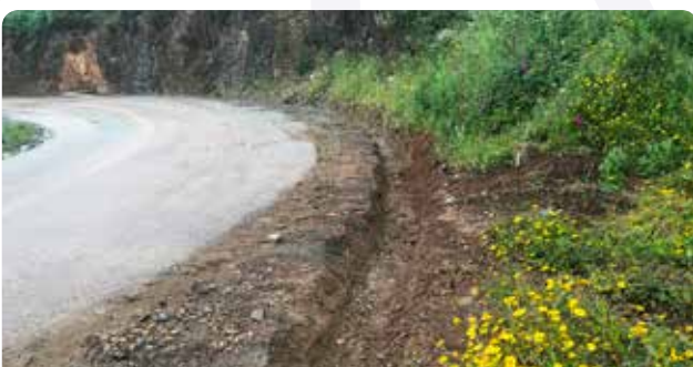
Abertura de valeta e colocação de meias manilhas em Pessegueiro