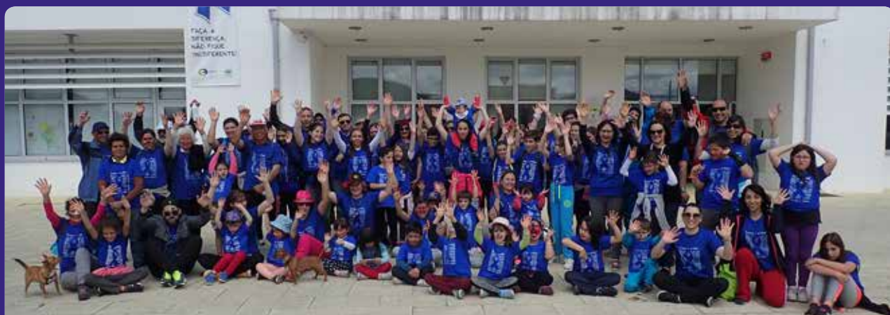
28 DE ABRIL - “Caminhada pelos Direitos da Criança - Eu não sou indiferente”, em Dornelas do Zêzere

Distribuição de marcadores com a história do laço azul, pela comunidade, serviços e estabelecimentos comerciais.