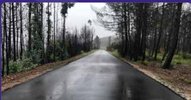
Pavimentação da estrada cruzamento EN112 - - Sobral Bendito - Casal da Silva - Rotunda de Carvalho