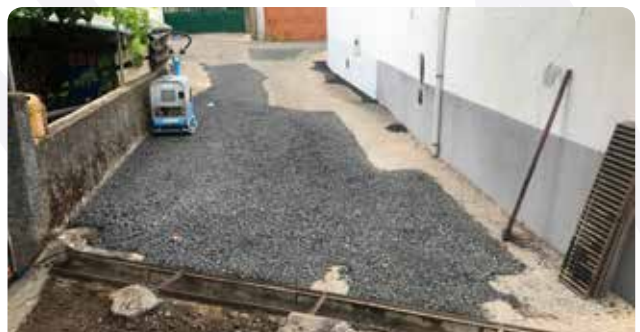
Requalificação de arruamentos em Pescaneco Fundeiro