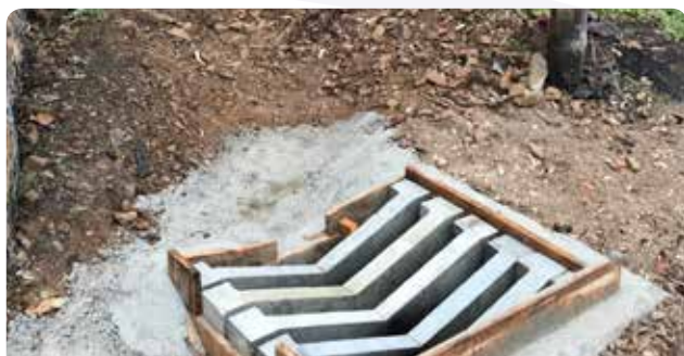
Construção de diversos aquedutos