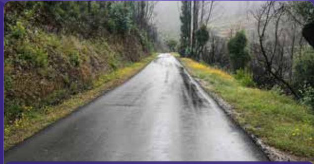
Pavimentação da estrada Trinhão - Vale Porco

Através de candidaturas a financiamentos de apoio que o Governo disponibilizou, na sequência dos incêndios de junho de 2017, foram requalificadas diversas vias municipais, que foram afetadas nesse período.