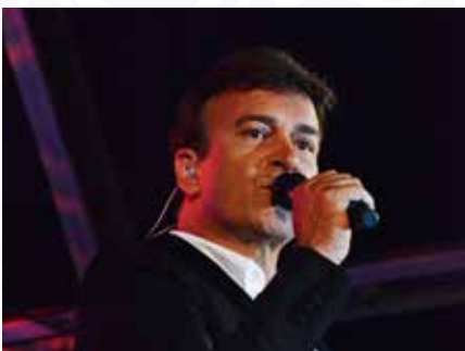
11 Concerto de Tony Carreira