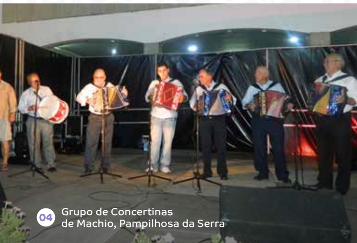
04 Grupo de Concertinas de Machio, Pampilhosa da Serra