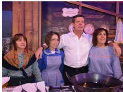
02 Freguesia de Dornelas do Zêzere