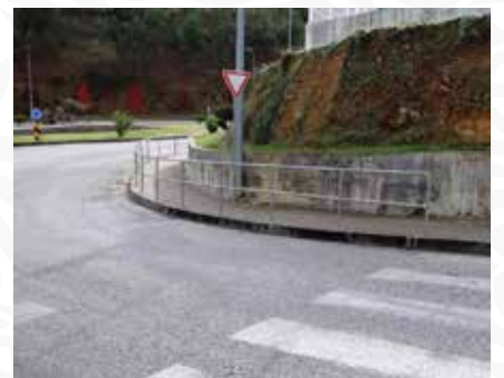
07 Colocação de gradeamento/proteção e rebaixamento de passeio junto ao Agrupamento de Escolas Escalada - Pampilhosa da Serra