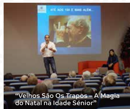
"Velhos São Os Trapos – A Magia do Natal na Idade Sénior"

mento e autoestima, confiança, resolução de problema e capacidade de resposta perante situações de stress.