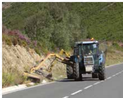
06 Limpeza de bermas em todas as Freguesias