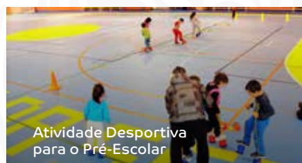
Atividade Desportiva para o Pré-Escolar

A equipa sénior feminina de futsal do Sporting Clube de Portugal-Núcleo de Condeixa realizou, de 9 a 11 de setembro, no Pavilhão Municipal, dois jogos de preparação para a época 2016/2017: o “Pampilhosa da Serra Women Cup 2016” e o “Troféu José Brito”.