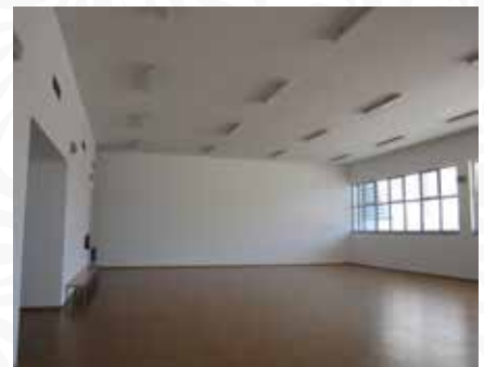
09 Reparações diversas no pavilhão desportivo do Centro Educativo de Dornelas do Zêzere