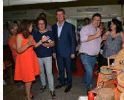
01 Expositor da Freguesia de Cabril