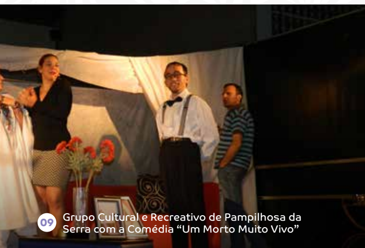
09 Grupo Cultural e Recreativo de Pampilhosa da Serra com a Comédia "Um Morto Muito Vivo"

As Noites de Verão voltam a trazer, em 2016, a animação permanente ao Centro da Vila de Pampilhosa da Serra.