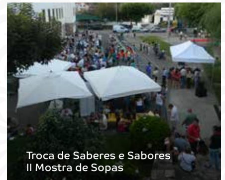
Troca de Saberes e Sabores II Mostra de Sopas