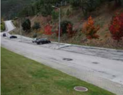
02 Obras de Requalificação de estacionamento em Pampilhosa da Serra