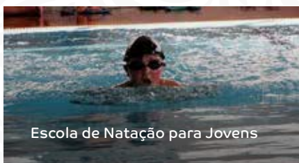
Escola de Natação para Jovens