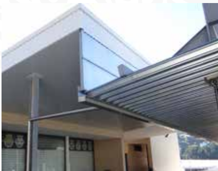
07 Requalificação de cobertura no Estádio Municipal