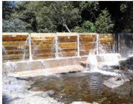
05 Apoio à Junta de Freguesia de Fajão-Vidual na requalificação de açude no Rio Ceira