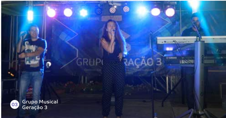
03 Grupo Musical Geração 3