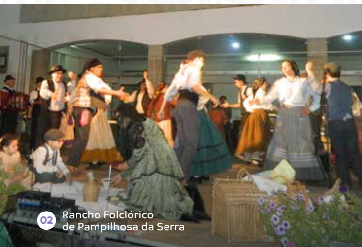
02 Rancho Folclórico de Pampilhosa da Serra