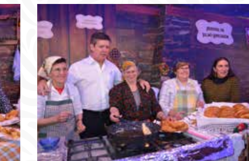
04 Freguesia de Janeiro de Baixo

O espaço de magia e ilusão criado a partir da sede dos Bombeiros Voluntários de Pampilhosa da Serra teve continuidade no exterior, na Praça do Regionalismo, com demonstração dos ofícios de antigamente, presépio ao vivo, bailarico tradicional, música e muita diversão!