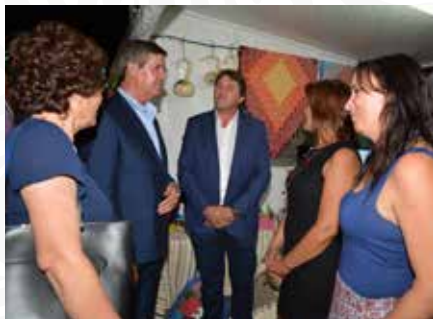
02 Expositor da Freguesia de Dornelas do Zêzere