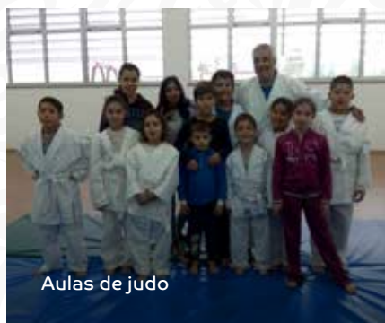
Aulas de judo