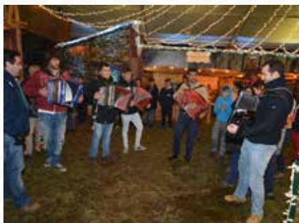
09 Bailarico Tradicional