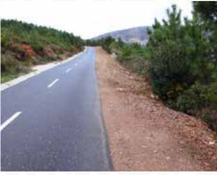
15 Limpeza e retificação de bermas na estrada Casa do Guarda - Vidual