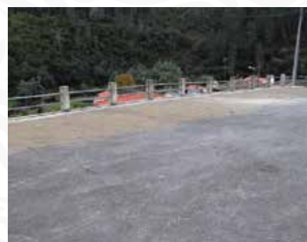
14 Retificação de pavimento no largo da Igreja em Pessegueiro