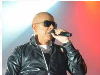
10 Concerto de Pedro Abrunhosa