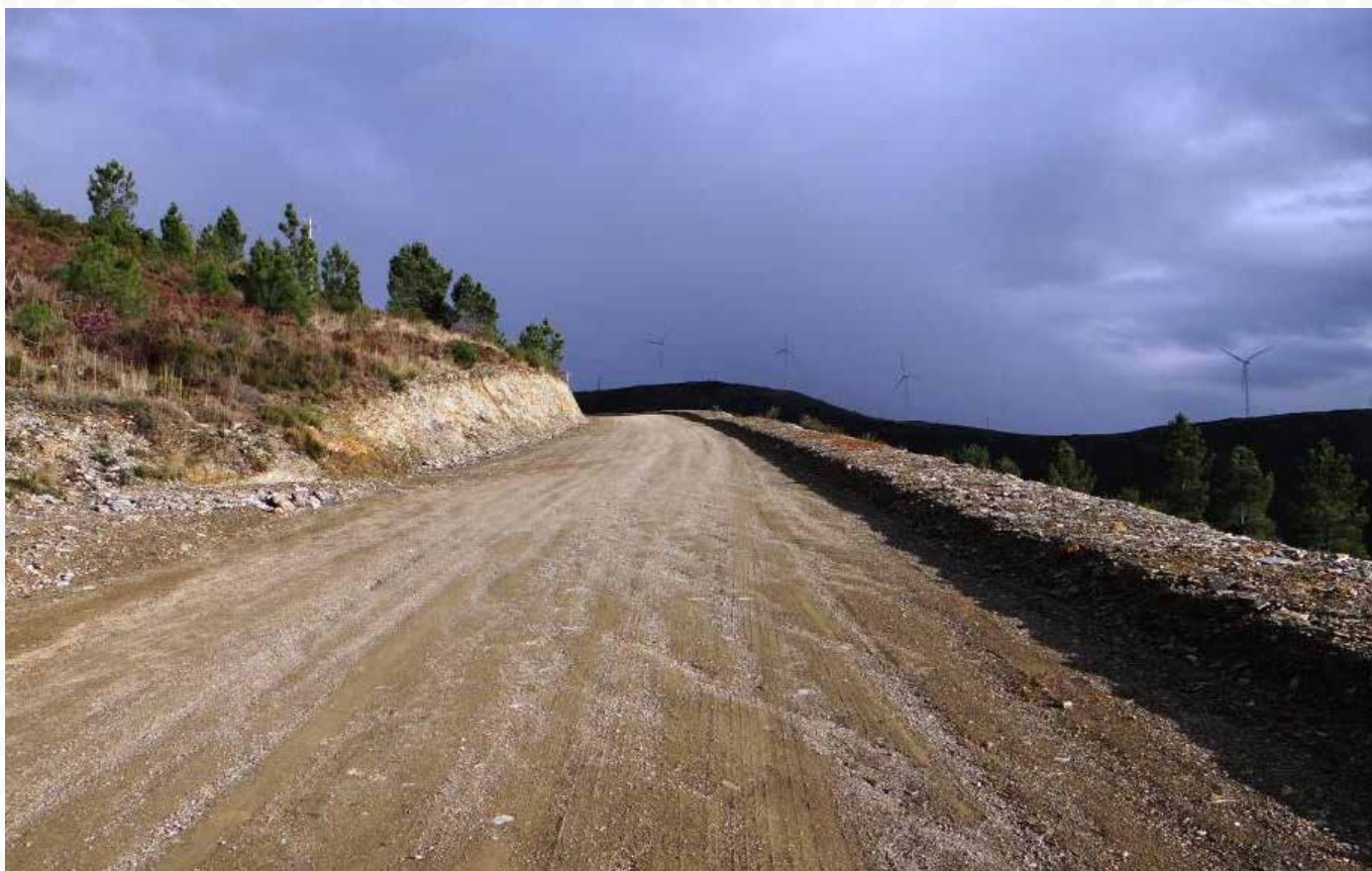
08 TRABALHOS DE REQUALIFICAÇÃO DA ESTRADA CRUZAMENTO CEIROCO-CAMBA