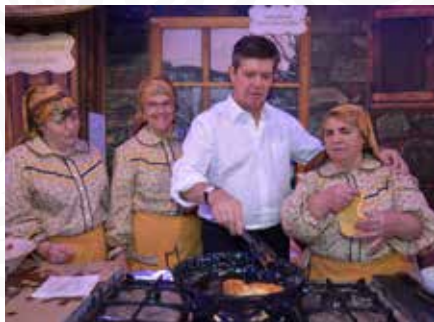
05 Freguesia de Pampilhosa da Serra