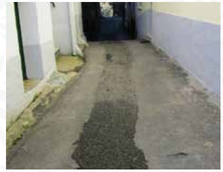
03 Substituição de ramal em Adurão