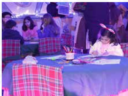
10 Eira da Brincadeira