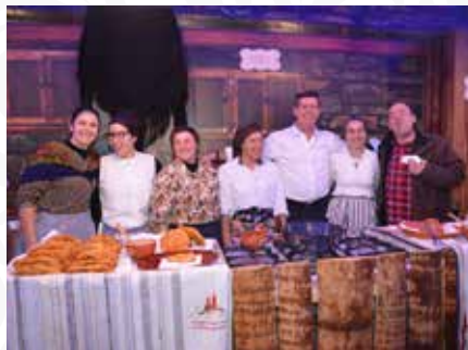
06 Freguesia de Pessegueiro