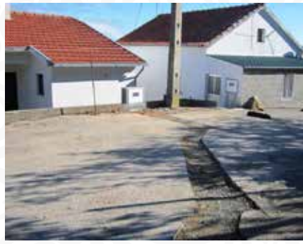
02 Substituição de baixadas de água em Portas do Souto