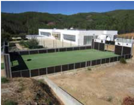
04 Manutenção de minicampo em Dornelas do Zêzere