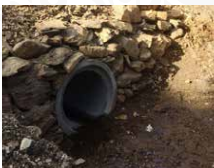
09 Colocação de aquedutos nas estradas de Ribeiros - Vale Derradeiro, Sobral Magro e Lobatos