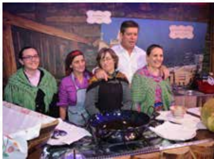
01 Freguesia de Cabril