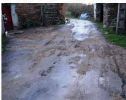
13 Desvio de águas pluviais em Padrões