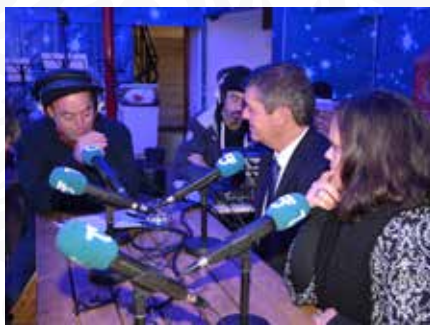
13 Programa Terra a Terra da rádio TSF