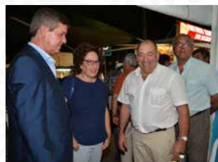
08 Expositor da Freguesia de Unhais-o-Velho

As Festas do Concelho de Pampilhosa da Serra são vividas anualmente por milhares de pessoas, que aqui se encontram, reencontram ou simplesmente, vêm conhecer e disfrutar do concelho.