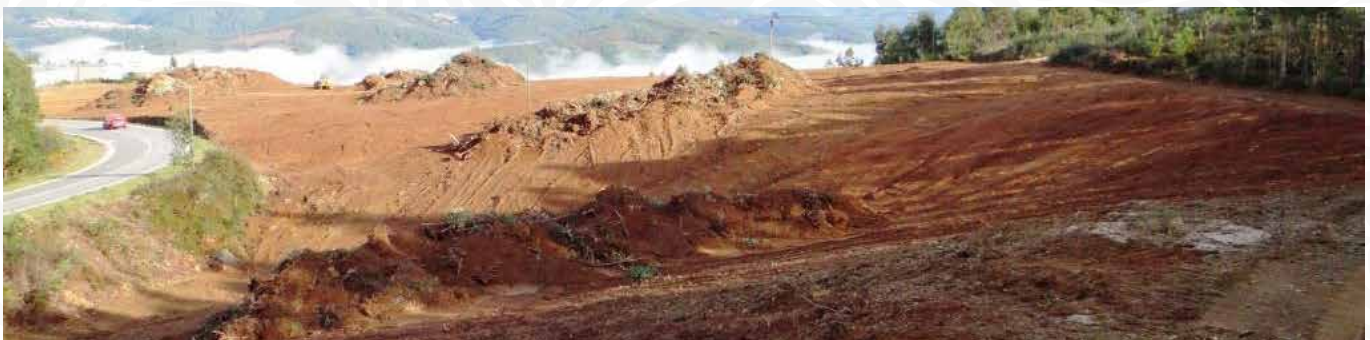
10 INÍCIO DAS TERRAPLANAGENS PARA ALARGAMENTO DA ZONA INDUSTRIAL DO ALTO DAS ALDEIAS