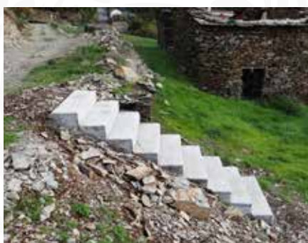
12 Construção de novos acessos em arruamento de Porto da Balsa