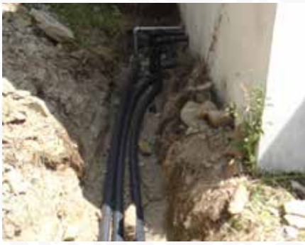
01 Conclusão da colocação de conduta adutora entre Amoreira e Vilar