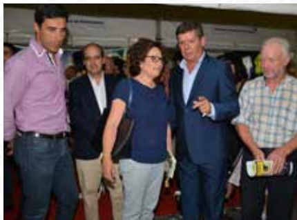
03 Expositor da Freguesia de Fajão-Vidal