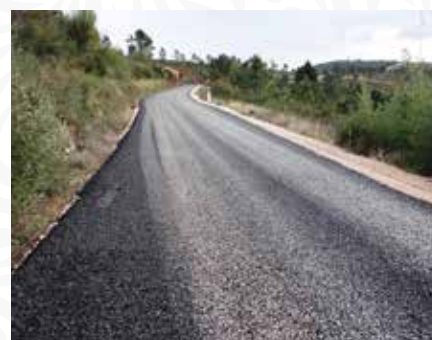
11 Pavimentação da estrada de Decabelos