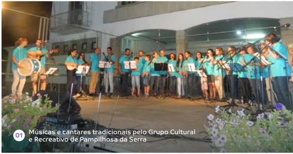
01 Músicas e cantares tradicionais pelo Grupo Cultural e Recreativo de Pampilhosa da Serra