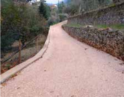
17 Construção de novo arruamento em Pessegueiro