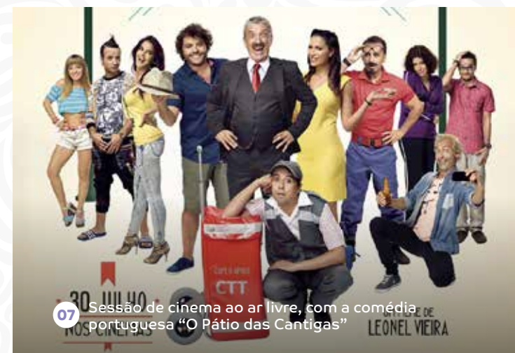
07 Sessão de cinema ao ar livre, com a comédia portuguesa "O Pátio das Cantigas"