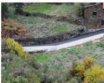
10 Construção de muro de consolidação de arruamento em Decabelos