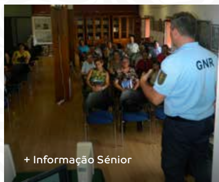
+ Informação Sénior