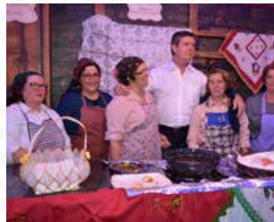
07 Freguesia de Portela do Fojo-Machio