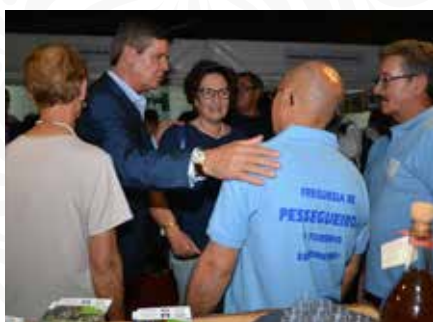
06 Expositor da Freguesia de Pessegueiro