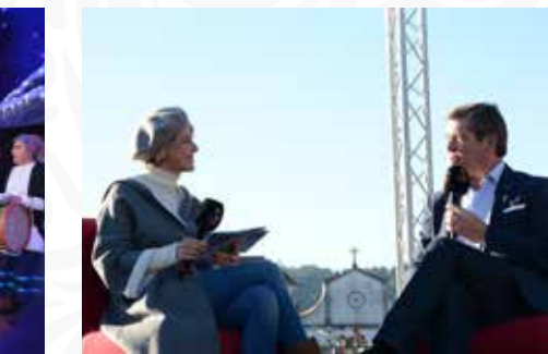
12 Programa da TVI “Somos Portugal”

O Programa Terra-a-Terra foi transmitido em direto pelos microfones da TSF, inserido no evento “Pampilhosa da Serra Inspira Natal”. A emissão decorreu no dia 17 de dezembro, dando voz às gentes e aos locais do concelho, através de conversas e reportagens que revelaram as paisagens, a gastronomia, a cultura, o património e as histórias de Pampilhosa da Serra.