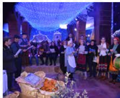
11 Grupo Cultural e Recreativo de Pampilhosa da Serra