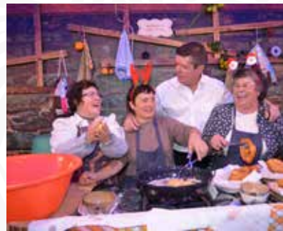
03 Freguesia de Fajão-Vidual