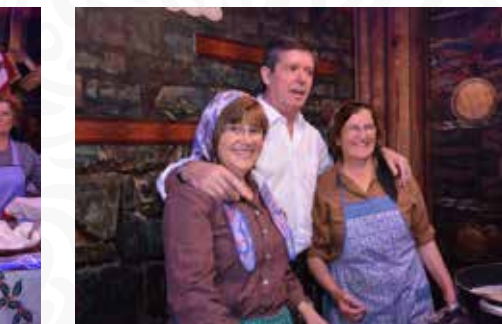
08 Freguesia de Unhais-o-Velho