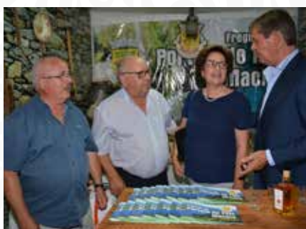
07 Expositor da Freguesia de Portela do Fojo-Machio