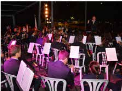
09 Concerto Inaugural pelo Grupo Musical Fraternidade Pampilhosense