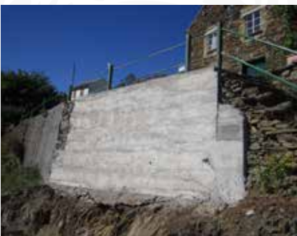
05 Reconstrução de muro de suporte de arruamento em Arranhadouro