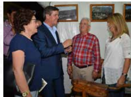
04 Expositor da Freguesia de Janeiro de Baixo