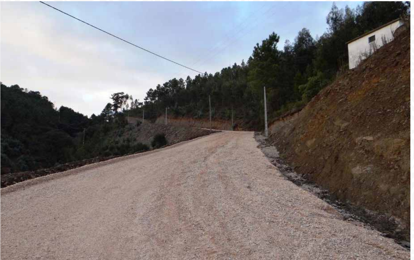
01 RETIFICAÇÃO, ALARGAMENTO E COLOCAÇÃO DE AQUEDUTOS DA ESTRADA PORTELA DO FOJO - VILAR