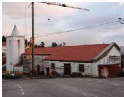
08 Apoio às obras de requalificação da Igreja Paroquial em Portela do Fojo