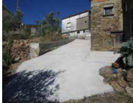
03 Colocação de cimento em arruamento de Brejo de Cima