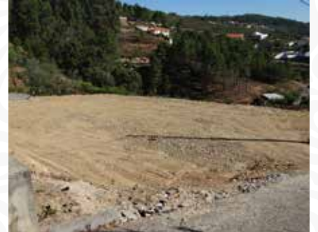
04 Terraplanagem para parque de estacionamento em Lobatos