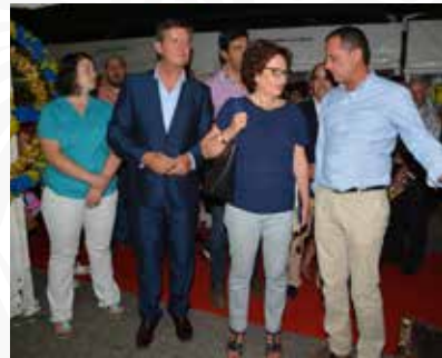
05 Expositor da Freguesia de Pampilhosa da Serra