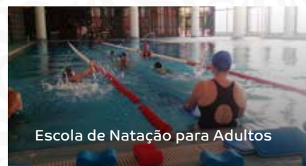
Escola de Natação para Adultos