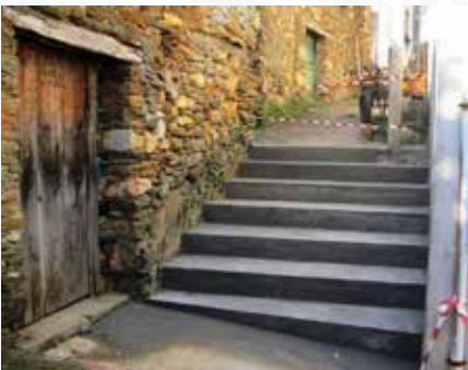
18 Requalificação de escadaria em Adurão