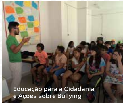
Educação para a Cidadania e Ações sobre Bullying