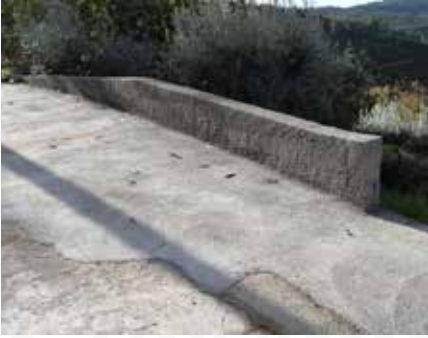
16 Construção de muro de suporte de arruamento em Aldeia do Meio