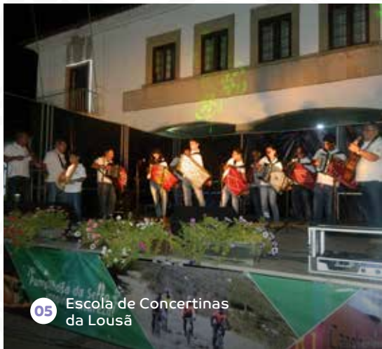
05 Escola de Concertinas da Lousã