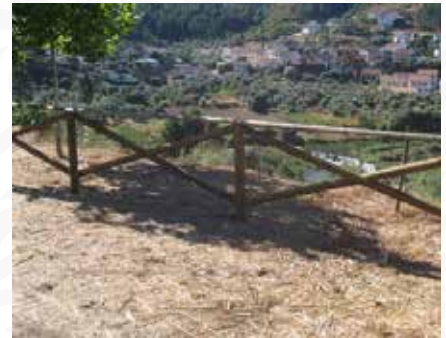
06 Colocação de gradeamento em miradouro no Porto de Vacas