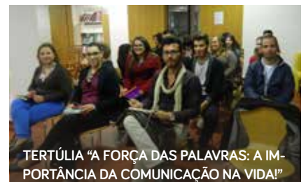
TERTÚLIA “A FORÇA DAS PALAVRAS: A IMPORTÂNCIA DA COMUNICAÇÃO NA VIDA!”

O Conselho reuniu também os seus parceiros no dia 7 de junho, para apresentação do programa “Garantia Jovem”, que visa a constituição de uma Rede Local de Parceiros para identificação e registo de jovens em situação de desemprego, com vista à sua integração numa reposição de trabalho, ocupação ou estágio pro-