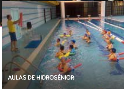
AULAS DE HIDROSÉNIOR