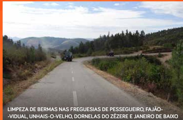
LIMPEZA DE BERMAS NAS FREGUESIAS DE PESSEGUIRO, FAJÃO- -VIDUAL, UNHAIS-O-VELHO, DORNELAS DO ZÉZERE E JANEIRO DE BAIXO