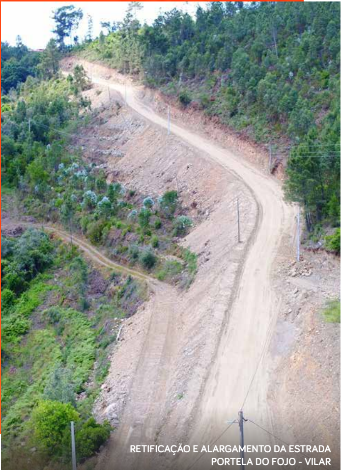
RETIFICAÇÃO E ALARGAMENTO DA ESTRADA PORTELA DO FOJO - VILAR

O Município de Pampilhosa da Serra tem assumido responsabilidades crescentes em todas as funções relacionadas com o planeamento e gestão da ocupação do território, bem como de muitas das infraestruturas implantadas, melhoradas ou requalificadas. Esta atuação reflete-se, não só na reabilitação de vias municipais e arruamentos, como num conjunto de intervenções que têm tornado possível a melhoria da qualidade de vida dos cidadãos e de quem visita o concelho. As intervenções realizadas vão desde a retificação e alargamento de estradas, como por exemplo da estrada municipal Camba-Ceiroco e Portela do Fojo-Vilar, ou novos arruamentos, até à colocação de bandas redutoras de velocidade, execução de passeio pedonal em Portela de Unhais e de valetas na estrada Portela de Unhais-Póvoa da Raposeira.