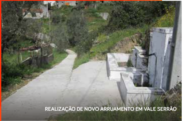
REALIZAÇÃO DE NOVO ARRUAMENTO EM VALE SERRÃO