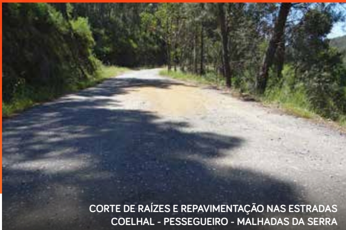
CORTE DE RAÍZES E REPAVIMENTAÇÃO NAS ESTRADAS COELHAL - PESSEGUIERO - MALHADAS DA SERRA