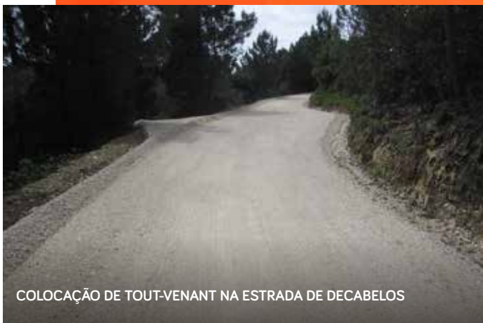
COLOCAÇÃO DE TOUT-VENANT NA ESTRADA DE DECABELOS