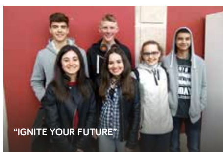
"IGNITE YOUR FUTURE"