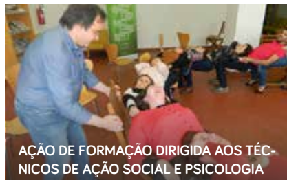
AÇÃO DE FORMAÇÃO DIRIGIDA AOS TÉCNICOS DE AÇÃO SOCIAL E PSICOLOGIA

O Núcleo Executivo do Conselho Local de Ação Social de Pampilhosa da Serra reuniu no dia 29 de março para aprovação do Plano de Ação para 2016, reunião na qual foi ainda aprovado o recurso à contratação de serviços do CLDS “Pampilhosa ATIVA”.