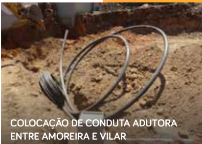
COLOCAÇÃO DE CONDUITA ADUTORA ENTRE AMOREIRA E VILAR