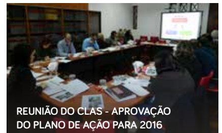
REUNIÃO DO CLAS - APROVAÇÃO DO PLANO DE AÇÃO PARA 2016