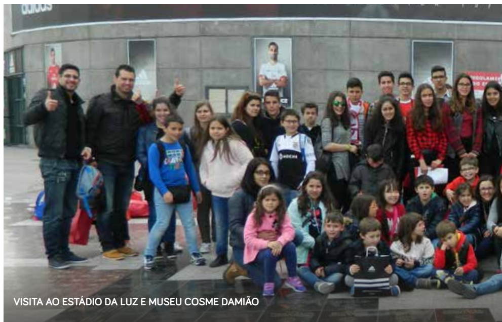
VISITA AO ESTÁDIO DA LUZ E MUSEU COSME DAMIÃO

A ação denominada “Family Buildings”, define-se como um encontro ou reencontro de memória, expensor de experiências e impulsor de caminhos. Esta ação de educação parental para pais e filhos decorreu em Dornelas do