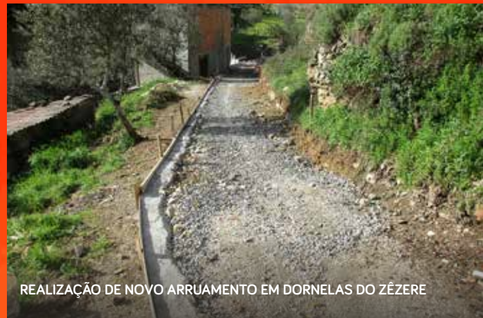
REALIZAÇÃO DE NOVO ARRUAMENTO EM DORNELAS DO ZÉZERE