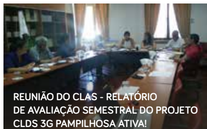
REUNIÃO DO CLAS - RELATÓRIO DE AVALIAÇÃO SEMESTRAL DO PROJETO CLDS 3G PAMPILHOSA ATIVA!