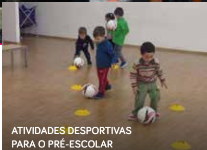
ATIVIDADES DESPORTIVAS PARA O PRÉ-ESCOLAR