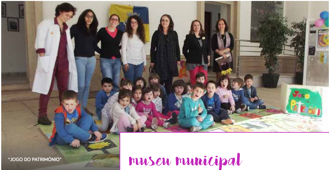
“JOGO DO PATRIMÓNIO”