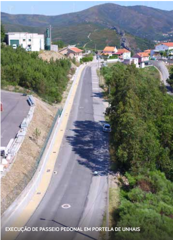
EXECUÇÃO DE PASSEIO PEDONAL EM PORTELA DE UNHAIS