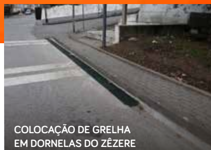
COLOCAÇÃO DE GRELHA EM DORNELAS DO ZÊZERE