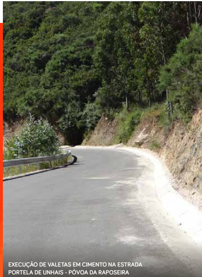
EXECUÇÃO DE VALETAS EM CIMENTO NA ESTRADA PORTELA DE UNHAIS - PÓVOA DA RAPOSEIRA