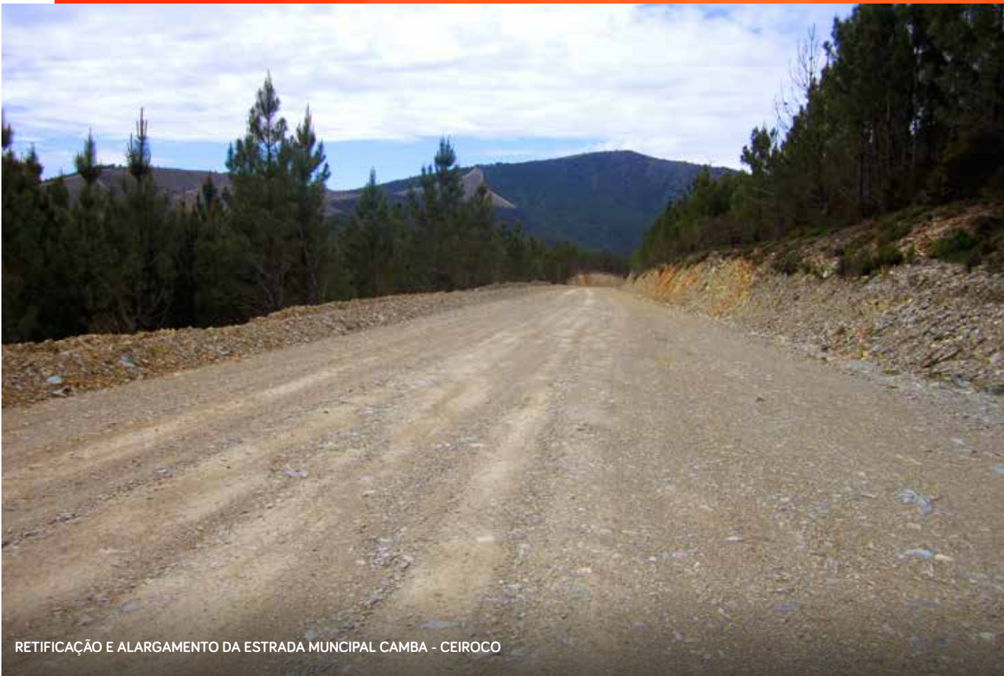
RETIFICAÇÃO E ALARGAMENTO DA ESTRADA MUNICIPAL CAMBA - CEIROCO