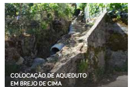
COLOCAÇÃO DE AQUEDUTO EM BREJO DE CIMA