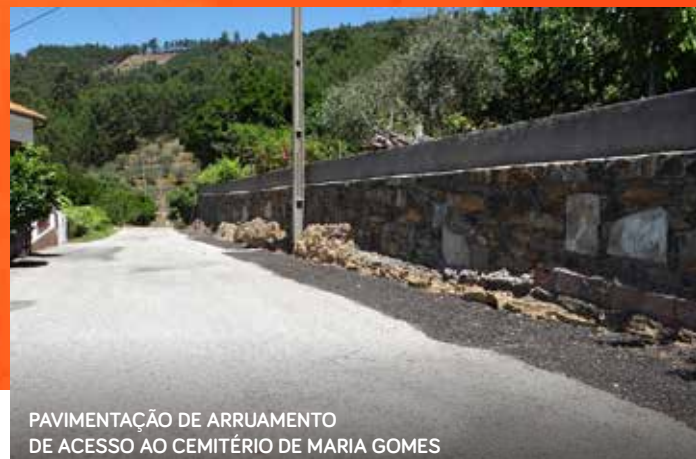
PAVIMENTAÇÃO DE ARRUAMENTO DE ACESSO AO CEMITÉRIO DE MARIA GOMES