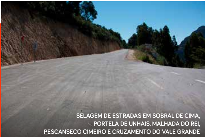
SELAGEM DE ESTRADAS EM SOBRAL DE CIMA, PORTELA DE UNHAIS, MALHADA DO REI, PESCANSECO CIMEIRO E CRUZAMENTO DO VALE GRANDE