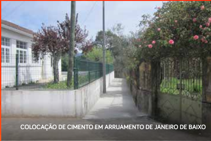
COLOCAÇÃO DE CIMENTO EM ARRUAMENTO DE JANEIRO DE BAIXO