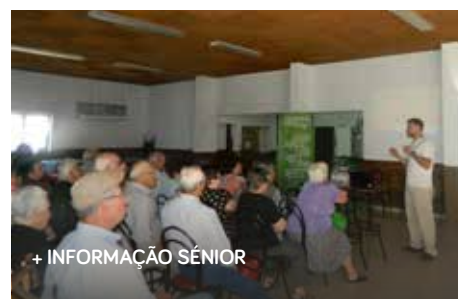
+ INFORMAÇÃO SÉNIOR