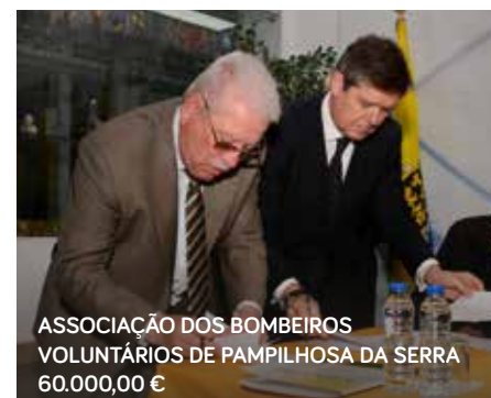
ASSOCIAÇÃO DOS BOMBEIROS VOLUNTÁRIOS DE PAMPILHOSA DA SERRA 60.000,00 €

No decorrer das cerimónias foram assinados sete Protocolos de Colaboração e Apoio Financeiro com entidades e organismos locais, que mantêm atividades de interesse e relevância municipal: