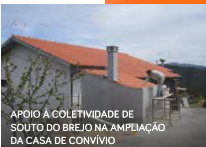
APOIO À COLETIVIDADE DE SOUTO DO BREJO NA AMPLIAÇÃO DA CASA DE CONVÍVIO

De referir, neste sentido, o apoio à Junta de Freguesia de Pampilhosa da Serra na pintura de tanques florestais em Lomba do Barco e Pescansecos do Meio ou ainda o apoio às coletividades, como por exemplo, o apoio na construção da Casa de Convívio nas Boiças e o apoio na ampliação da Casa de Convívio do Souto do Brejo.