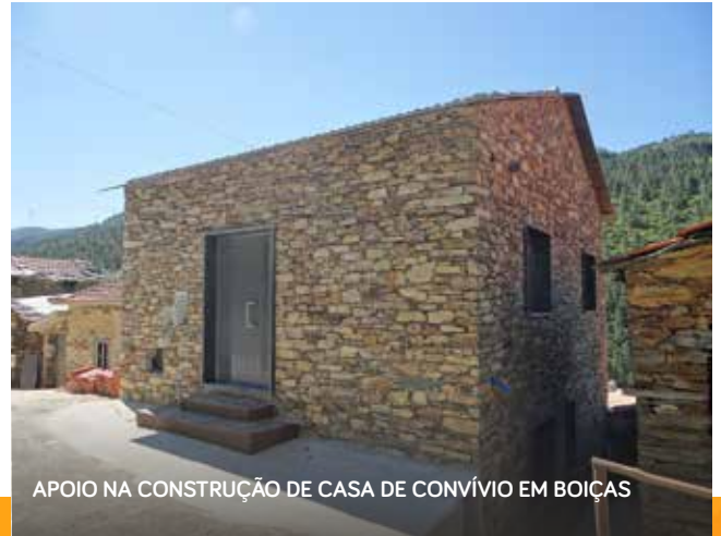
APOIO NA CONSTRUÇÃO DE CASA DE CONVÍVIO EM BOIÇAS