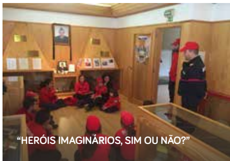
“HERÓIS IMAGINÁRIOS, SIM OU NÃO?”

Para assinalar a data foram desenvolvidas um conjunto de atividades de promoção do património do concelho, nomeadamente o “Jogo do Património” e a exposição “Heróis Imaginários, sim ou não?”.