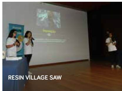
RESIN VILLAGE SAW

A cultura empreendedora imprimida pelo Município de Pampilhosa da Serra junto dos mais jovens já começa a dar os seus frutos, através do reconhecimento que tem vindo a ser dado ao trabalho realizado pelos jovens Pampilhosenses.