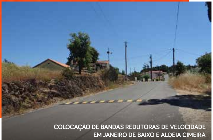
COLOCAÇÃO DE BANDAS REDUTORAS DE VELOCIDADE EM JANEIRO DE BAIXO E ALDEIA CIMEIRA