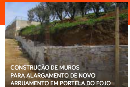
CONSTRUÇÃO DE MUROS PARA ALARGAMENTO DE NOVO ARRUAMENTO EM PORTELA DO FOJO