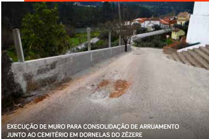
EXECUÇÃO DE MURO PARA CONSOLIDAÇÃO DE ARRUAMENTO JUNTO AO CEMITÉRIO EM DORNELAS DO ZÉZERE