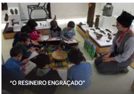
“O RESINEIRO ENGRAÇADO”