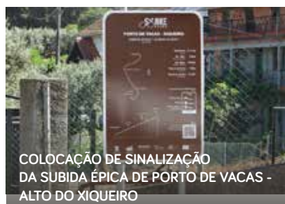
COLOCAÇÃO DE SINALIZAÇÃO DA SUBIDA ÉPICA DE PORTO DE VACAS - ALTO DO XIQUEIRO