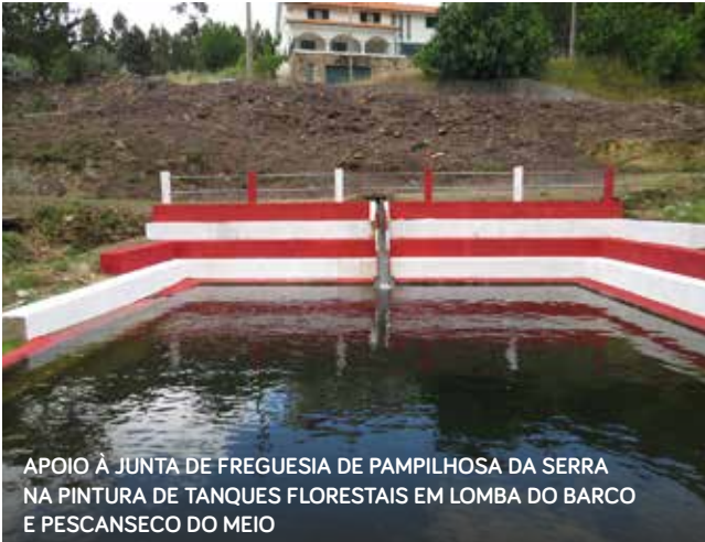
APOIO À JUNTA DE FREGUESIA DE PAMPILHOSA DA SERRA NA PINTURA DE TANQUES FLORESTAIS EM LOMBA DO BARCO E PESCANSECO DO MEIO