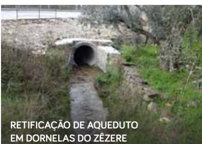
RETIFICAÇÃO DE AQUEDUTO EM DORNELAS DO ZÊZERE