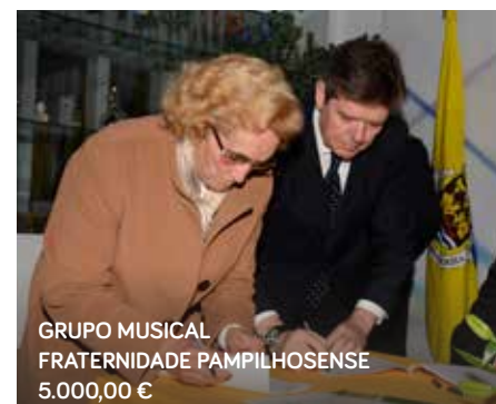
GRUPO MUSICAL FRATERNIDADE PAMPILHOSENSE 5.000,00 €