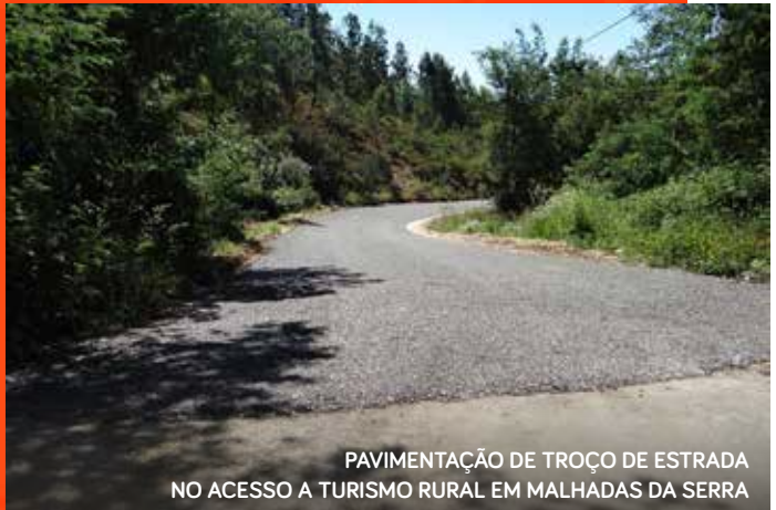
PAVIMENTAÇÃO DE TROÇO DE ESTRADA NO ACESSO A TURISMO RURAL EM MALHADAS DA SERRA