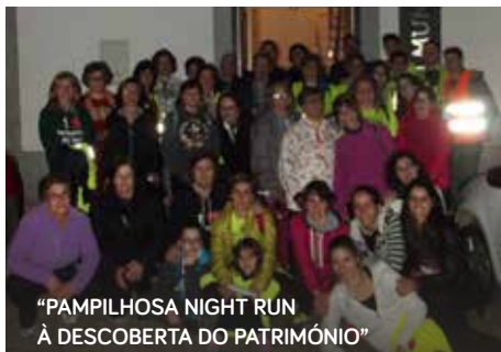
“PAMPILHOSA NIGHT RUN À DESCOBERTA DO PATRIMÓNIO”