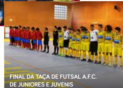
FINAL DA TAÇA DE FUTSAL A.F.C. DE JUNIORES E JUVENIS

O público mais jovem tem vindo a usufruir das atividades desportivas dirigidas ao Pré-escolar, Fit & Fun Kids, contando também com a Escola de Natação para crianças e jovens, que decorreram até final do ano letivo.