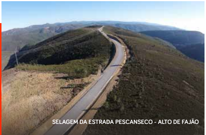
SELAGEM DA ESTRADA PESCANSECO - ALTO DE FAJÃO