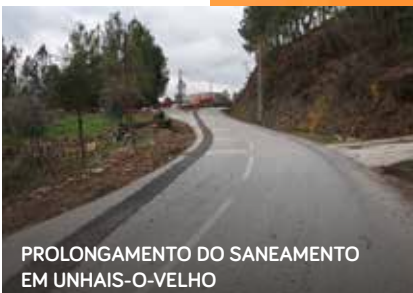
PROLONGAMENTO DO SANEAMENTO EM UNHAIS-O-VELHO

Tem constituído um desígnio da Câmara Municipal garantir com a maior qualidade o abastecimento de água às populações, assim como o tratamento de águas residuais, aliado a um conjunto de obras extensivas a todo o concelho. É pois, num quadro de política municipal sustentável e de responsabilidade social com a comunidade que o município tem desenvolvido o seu trabalho, com a realização de obras que vão ao encontro das necessidades das populações, nomeadamente em estreita colaboração com as Juntas de Freguesia, Coletividades e Associações concelhias.