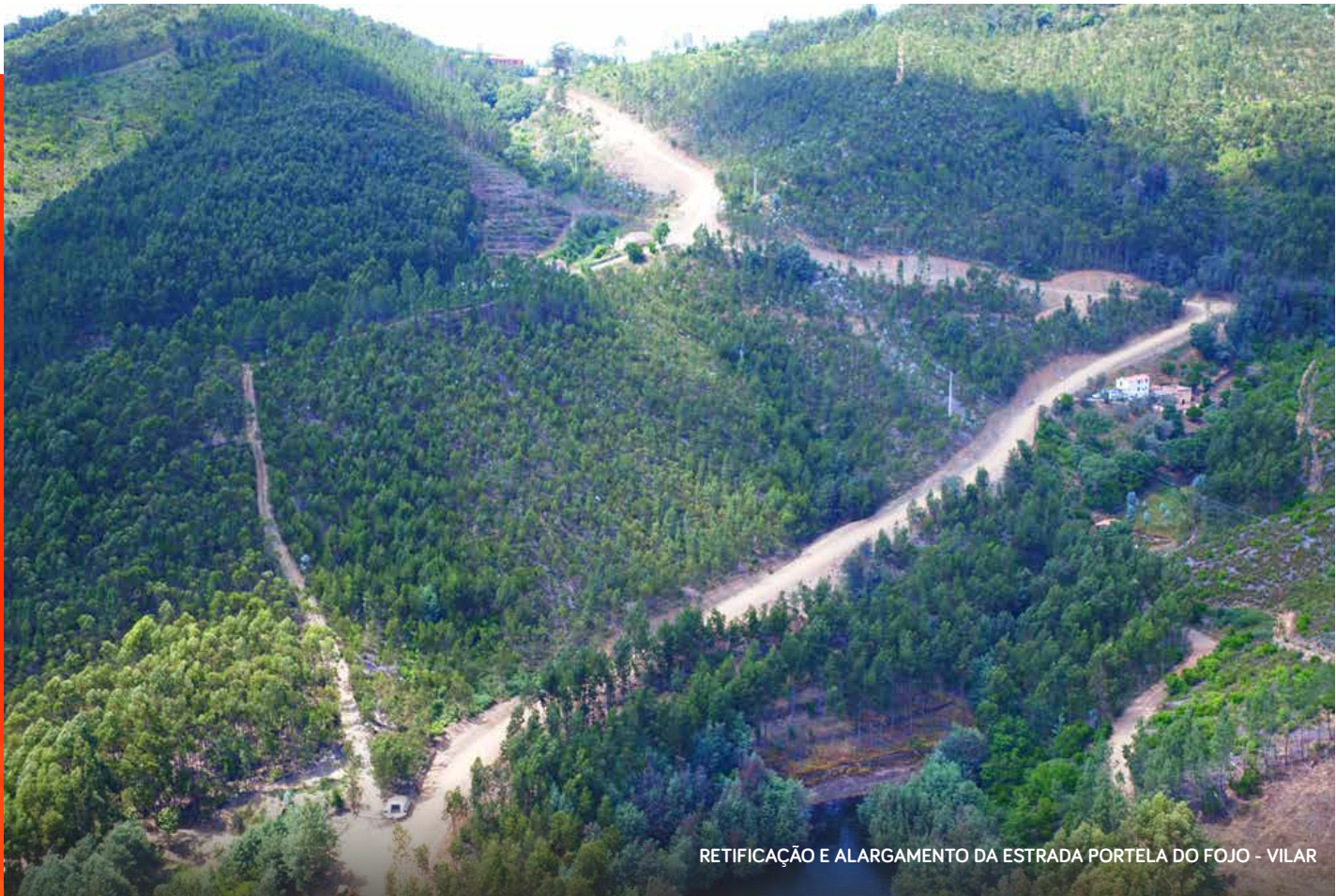
RETIFICAÇÃO E ALARGAMENTO DA ESTRADA PORTELA DO FOJO - VILAR

O Município de Pampilhosa da Serra tem assumido responsabilidades crescentes em todas as funções relacionadas com o planeamento e gestão da ocupação do território, bem como de muitas das infraestruturas implantadas, melhoradas ou requalificadas. Esta atuação reflete-se, não só na reabilitação de vias municipais e arruamentos, como num conjunto de intervenções que têm tornado possível a melhoria da qualidade de vida dos cidadãos e de quem visita o concelho. As intervenções realizadas vão desde a retificação e alargamento de estradas, como por exemplo da estrada municipal Camba-Ceiroco e Portela do Fojo-Vilar, ou novos arruamentos, até à colocação de bandas redutoras de velocidade, execução de passeio pedonal em Portela de Unhais e de valetas na estrada Portela de Unhais-Póvoa da Raposeira.