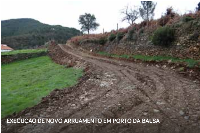
EXECUÇÃO DE NOVO ARRUAMENTO EM PORTO DA BALSA