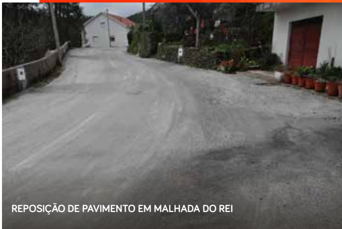
REPOSIÇÃO DE PAVIMENTO EM MALHADA DO REI