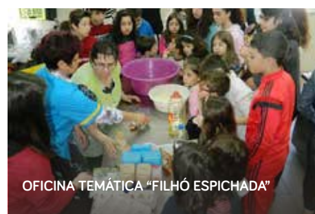
OFICINA TEMÁTICA "FILHÓ ESPICHADA"