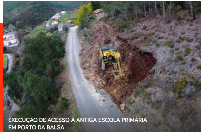
EXECUÇÃO DE ACESSO À ANTIGA ESCOLA PRIMÁRIA EM PORTO DA BALSA