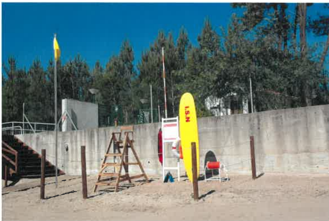
F_01 (Posto de vigia da praia)