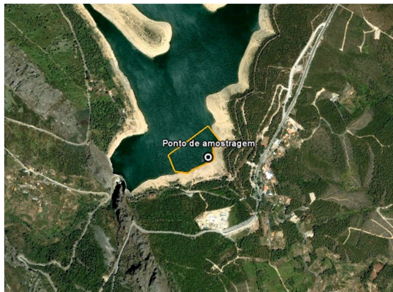
Figura 1 - Água balnear e ponto de amostragem (LAT 40.091107°, LONG -7.853218°, ETRS89)